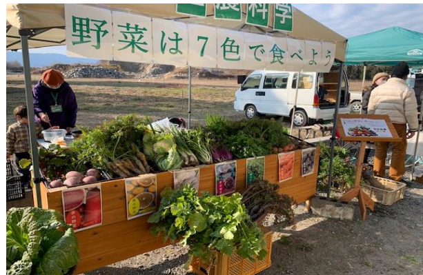
育てたものは実際にマルシェで販売！