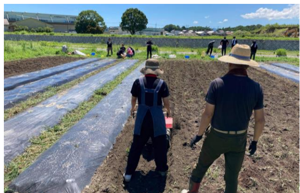
グループごとの畑実習