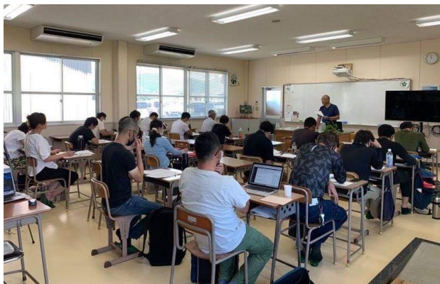
1日に1時間×4コマ受講